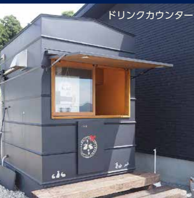
ドリンクカウンター

クルーザーは東は尾道・しまなみ海道、西は呉・とびしま 海道までカバーしております。 この海域はまさにキャプテンの「庭」です。