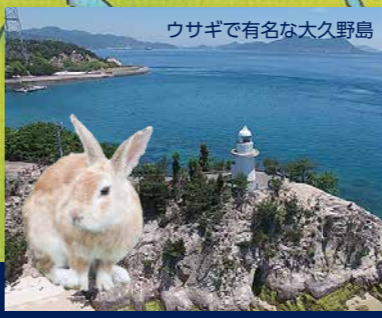
ウサギで有名な大久野島