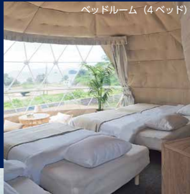
ベッドルーム (4ベッド)