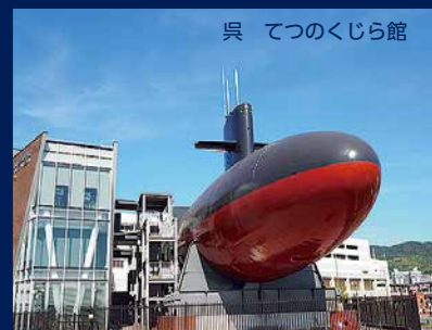
呉 てつこのくじら館