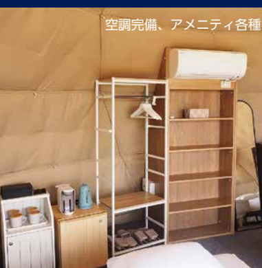
空調完備、アメニティ各種