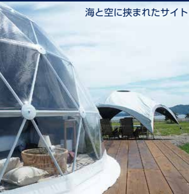
海と空に挟まれたサイト

専用のクルーザーで、あなただけのオリジナルプラン。 観光タクシーと組み合わせれば交通機関の時間を気にす ることなく、自由自在に瀬戸内を往来できます。 クルーザーのみのご利用も可能です。ご旅行だけでなく ウエディング、七五三等記念イベントにもどうぞ。