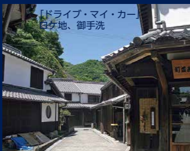
【ドライブ・マイ・カー】 白地、御手洗