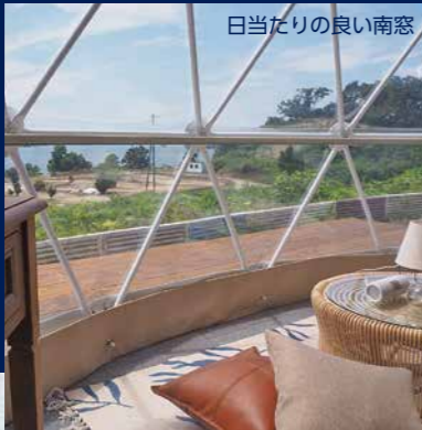
日当たりの良い南窓