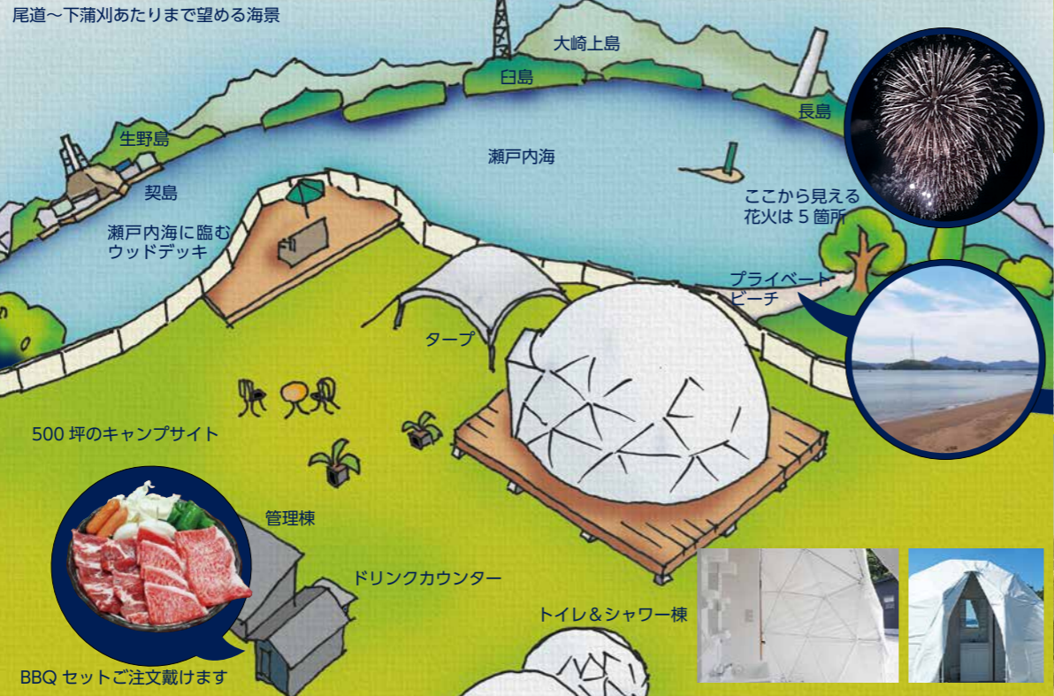
尾道～下蒲刈あたりまで望める海景