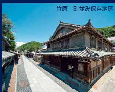
竹原 町並み保存地区